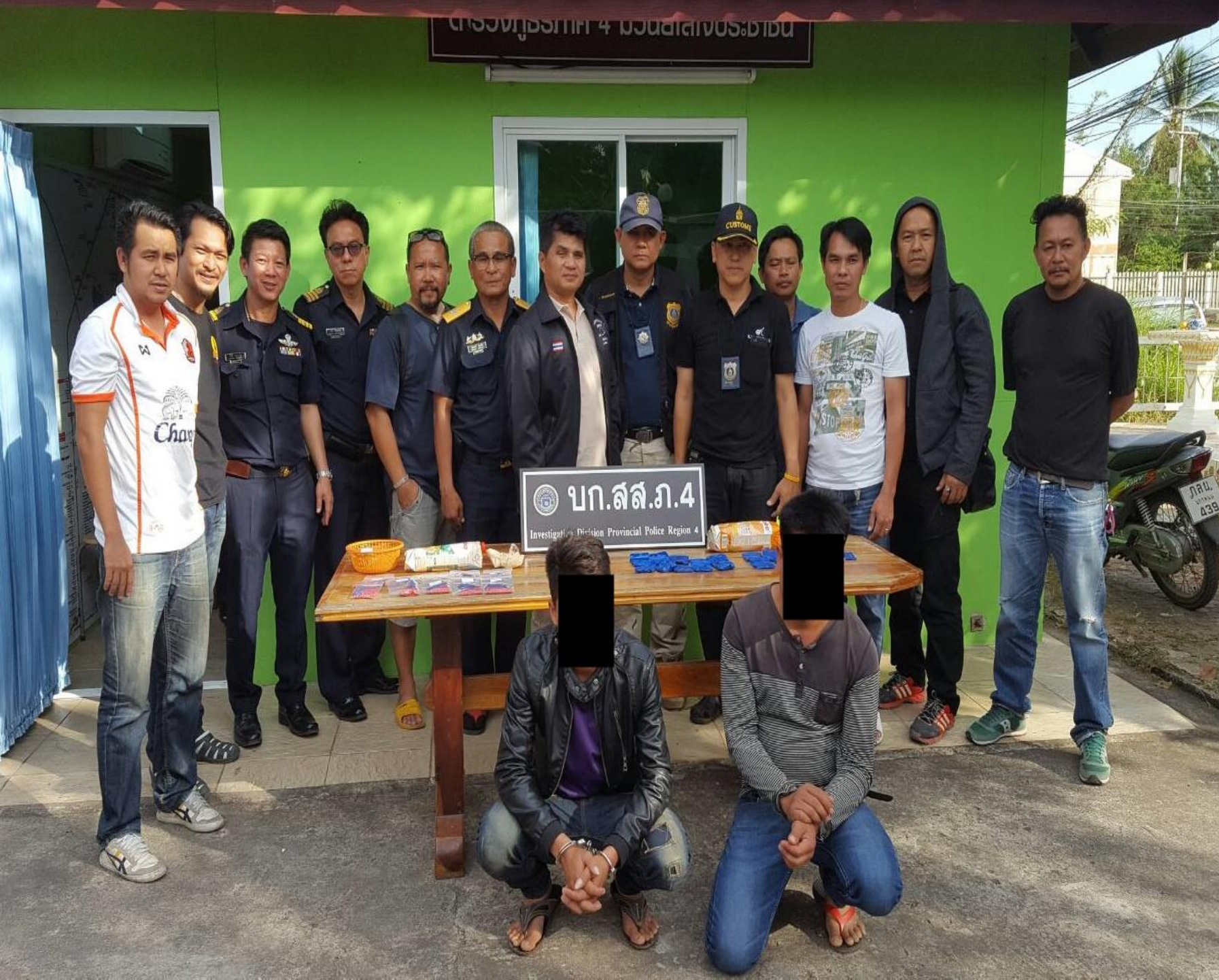
ทีมนคราชร่วมกับตำรวจ กองกำกับการสืบสวน ๑ กองบังคับการสืบสวนภาค ๔ ทีมจับกุมถ่ายรูปร่วมกัน